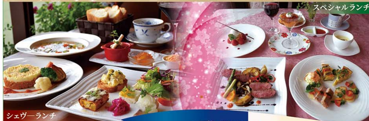
シェヴァーランチ