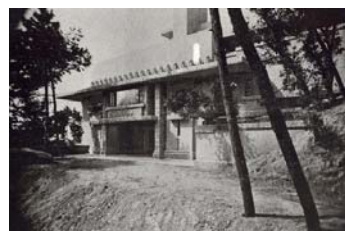
<建設当初のエントランス>