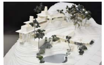
<建設当初の再現模型>