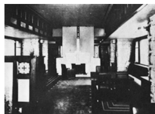
<建設当初の2階応接室>